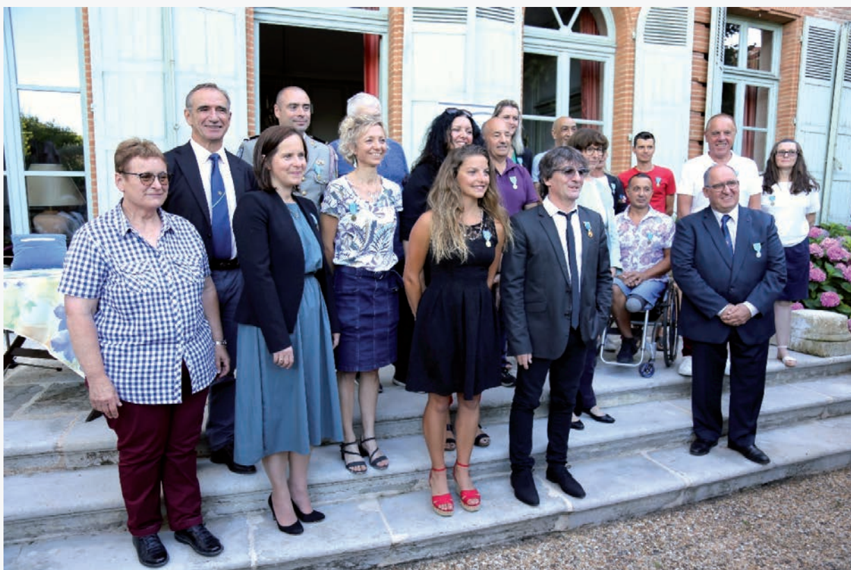
Remise des médailles dans le jardin de la préfecture